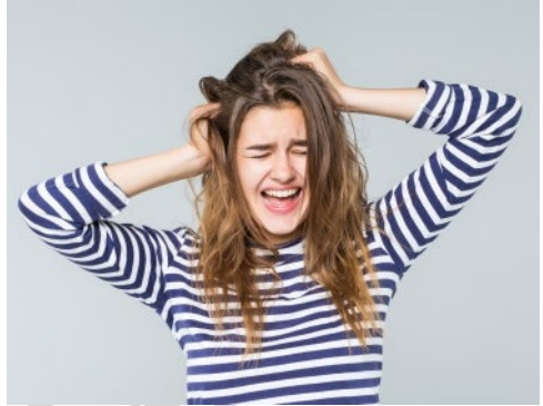
Las sustancias emolientes le devuelven al cabello la suavidad y promueven la hidratación.

Los emolientes son sustancias que suavizan la superficie de la piel y el cabello. La suavidad es la sensación que desean todos los clientes para su cabello.